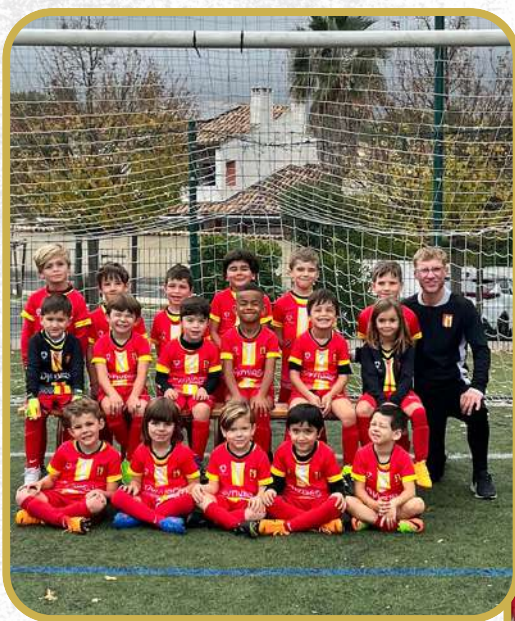
- Photo d'équipe officielle -